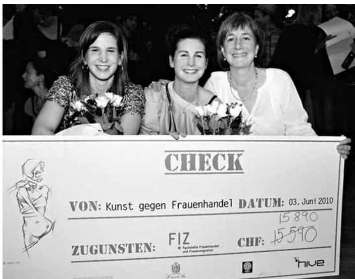
Kunst gegen Frauenhandel

tiver Energie und Grosszügigkeit geprägt. So kamen 16 000 Franken für das FIZ-Projekt Schutzwohnung zusammen. «Wir wollten etwas schaffen, was an diese Verbrechen, die täglich in unserer Nachbarschaft passieren, erinnert», so die beiden Organisatorinnen! Herzlichen Dank!